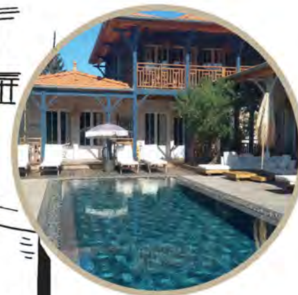
LA VILLA TCHANQUÉE [Chambres]