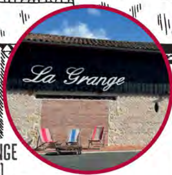
LA GRANGE [Salle]