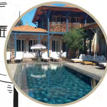
LA VILLA TCHANQUÉE [Chambres]